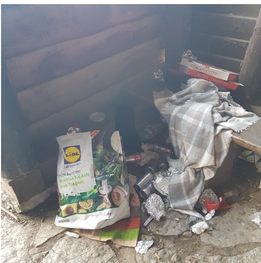
Bilder 002 bis 004; Hamburger Hütte, Hube; Aufnahmedatum: Mitte April 2021; Bildquelle: privat