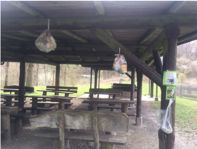
Bild 001; Grillplatz Hube; Aufnahmedatum: Mitte April 2021