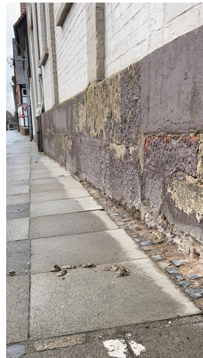
Bilder 008 bis 010; Eingang Kindergarten Pustelblume; Aufnahmedatum: Mitte April 2021