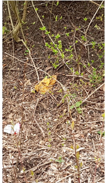
Bilder 005 bis 007; Kühner Höhenweg; Aufnahmedatum: Mitte April 2021